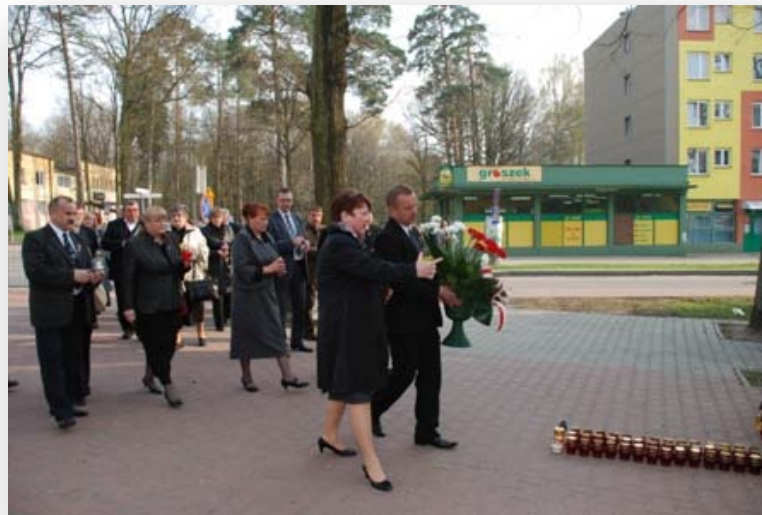
Wspólnie z władzami miasta i radnymi złożyliśmy kwiaty i zapaliliśmy znicze pod pomnikiem w centrum Poniatowej