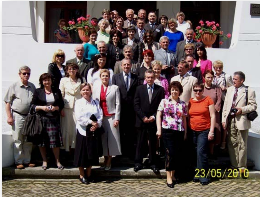
Regionaliści z Lubelszczyzny - uczestnicy Konferencji przed Pałacem w Kraczewicach