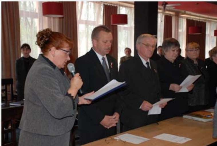
Uroczysta Sesja Rady Miejskiej poświęcona tragedii smoleńskiej