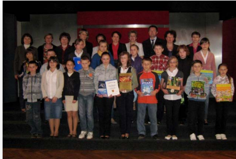
Uczestnicy konkursu wraz z wychowawcami i organizatorami